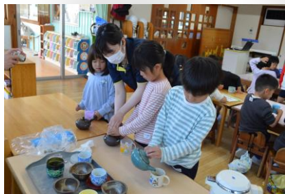
自分でいれたお茶を香りを嗅いで飲みます。