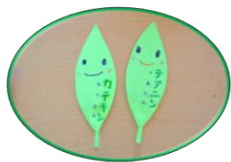
お茶の栄養や効能の話、お茶をいれる道具の説明を聞きます。