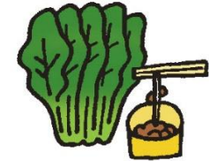
●非ヘム鉄 (ほうれん草、小松菜、納豆など)

肉や魚などの動物性食品に含まれているヘム鉄は吸収率が高いです。肉、レバーが苦手な方はかつおや、きはだマグロがおすすめです。あさは、缶詰・水煮を使用しても良いです。